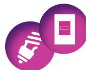
AMPOULES FLUOCOMPACTES / COMPTEUR LINKY 87 V/m