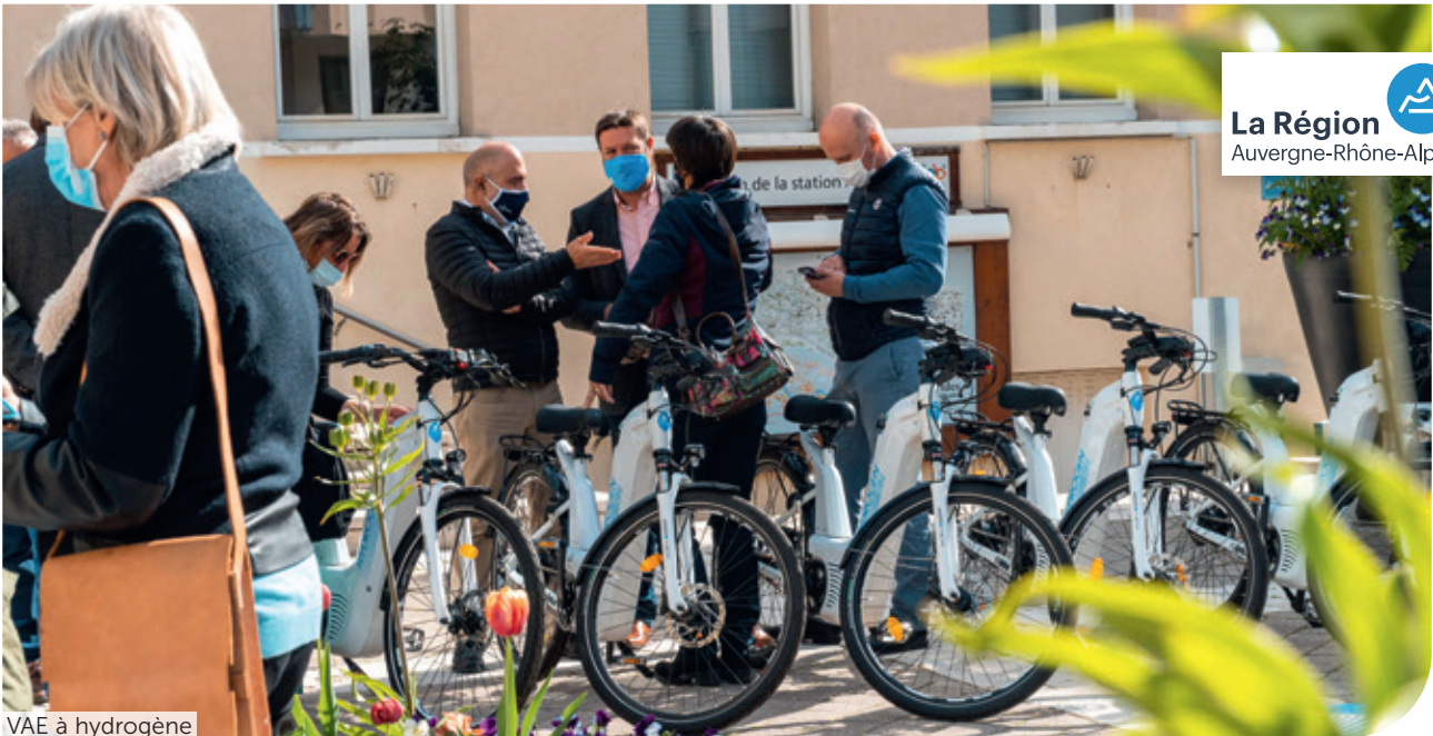
VAE à hydrogène