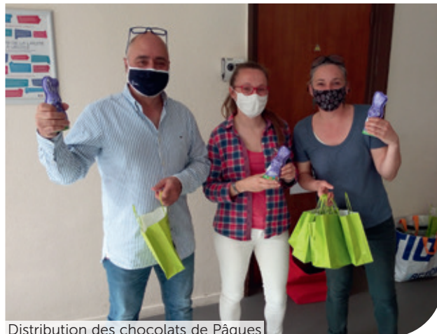
Distribution des chocolats de Pâques