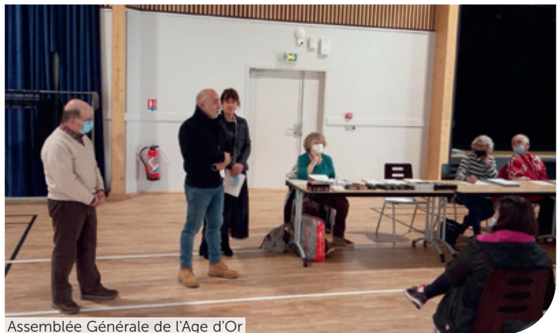
Assemblée Générale de l'Age d'Or