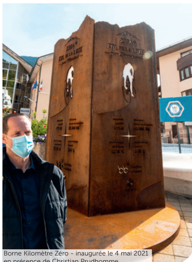
Borne Kilomètre Zéro - inaugurée le 4 mai 2021 en présence de Christian Prudhomme.

(le Kilomètre Zéro ) pour accéder au col de la Loze. Une borne a ainsi été installée sur la place du Centenaire pour matérialiser ce départ avec les informations de dénivelés, de pourcentages de pente que ce soit pour un passage par Méribel ou par Courchevel. Cette stèle a été inaugurée le 4 mai dernier en présence notamment de Monsieur Christian Prudhomme, Directeur du Tour de France.