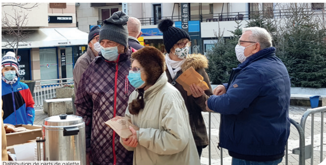
Distribution de parts de galette

Pour cette année 2021, 6 associations se sont vu attribuer une subvention et ces dernières sont à la disposition de toute personne se trouvant dans le besoin.