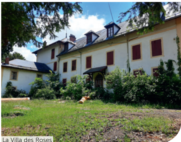
La Villa des Roses