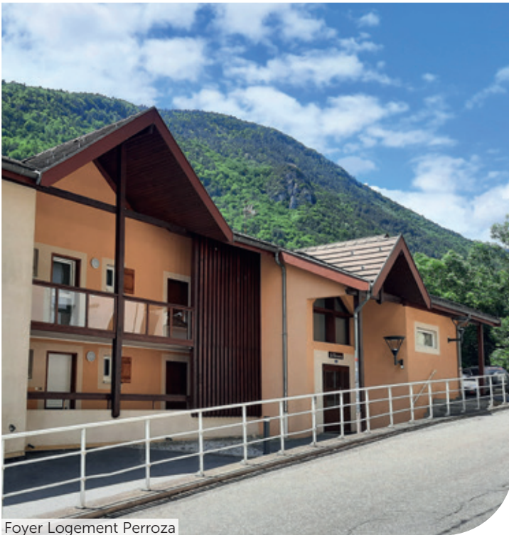
Foyer Logement Perroza