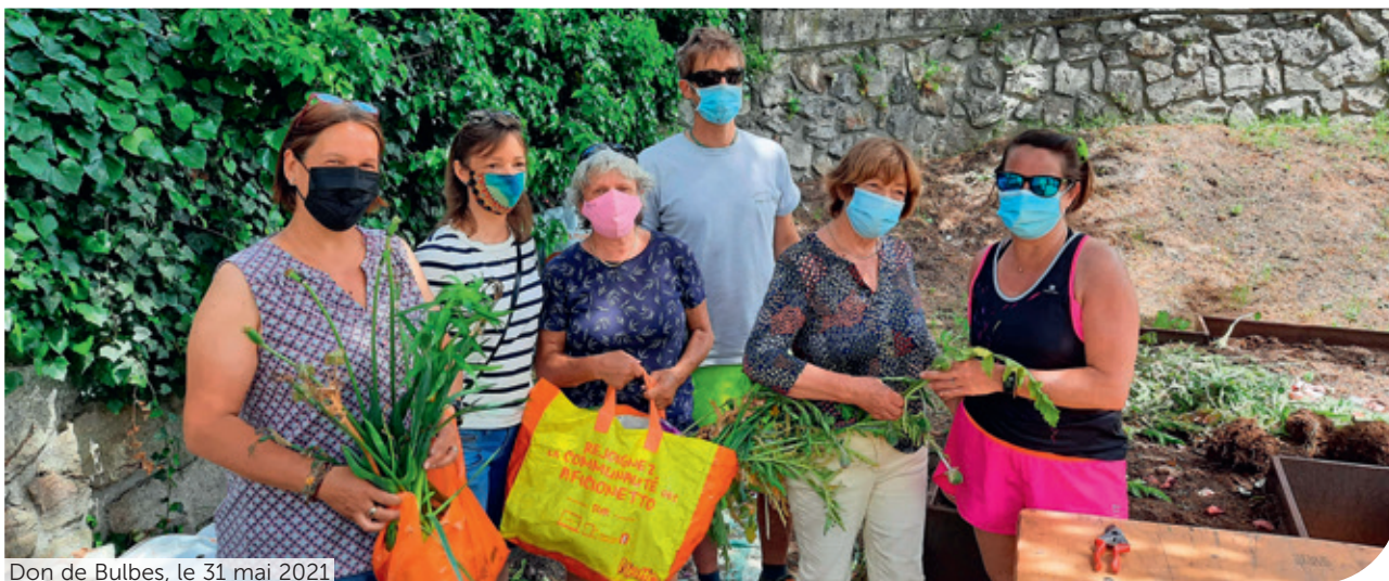
Don de Bulbes, le 31 mai 2021