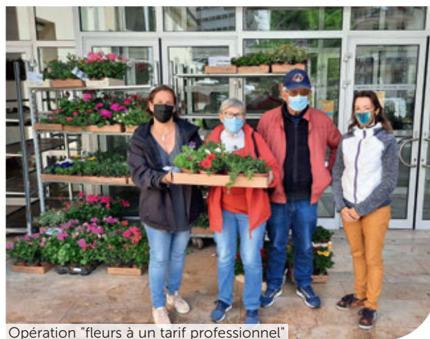
Opération "fleurs à un tarif professionnel"