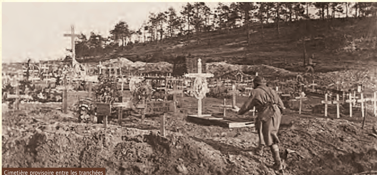
Cimetière provisoire entre les tranchées