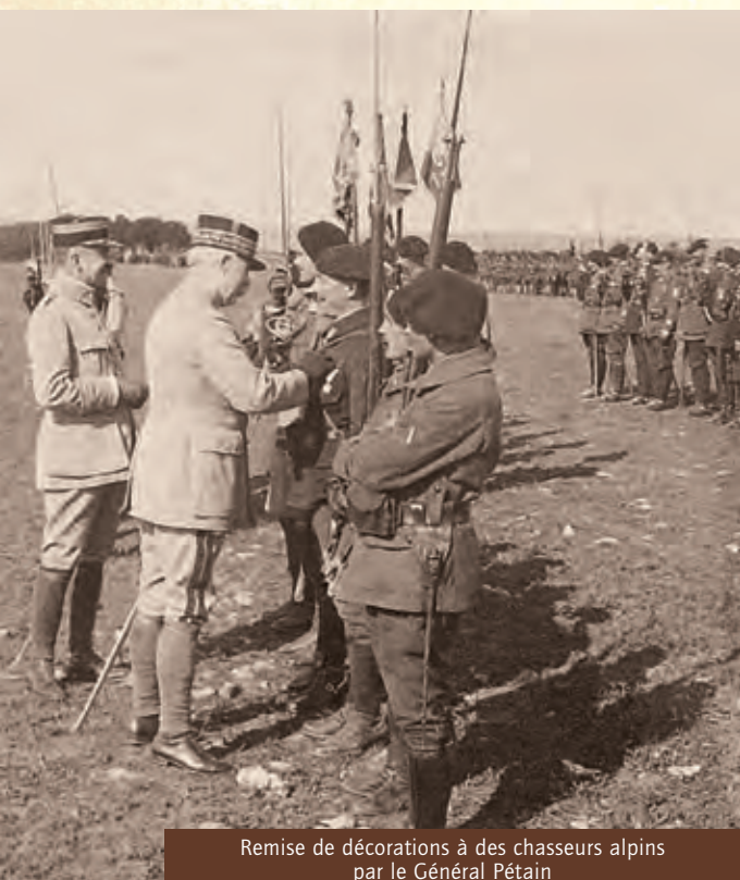
Remise de décorations à des chasseurs alpins par le Général Pétain