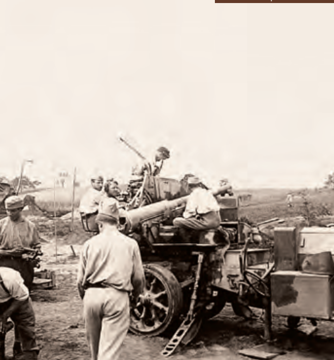
Canon autoporté en 1918