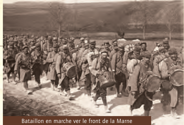
Bataillon en marche vers le front de la Marne