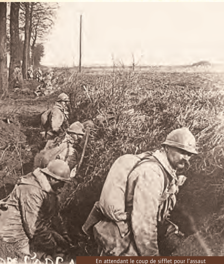
En attendant le coup de sifflet pour l'assaut