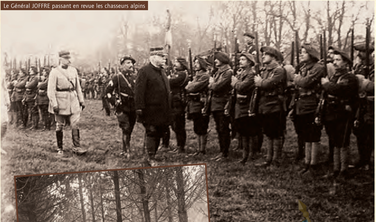
Le Général JOFFRE passant en revue les chasseurs alpins