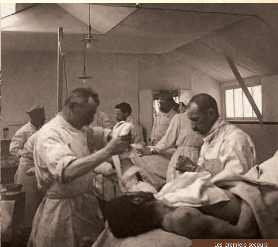
Les premiers secours

Le 20 mai 1916, il quitte les premières lignes du front car il est affecté comme adjoint au Colonel, commandant l'Armée Divisionnaire 62. Il occupe cette place pendant 2 mois.