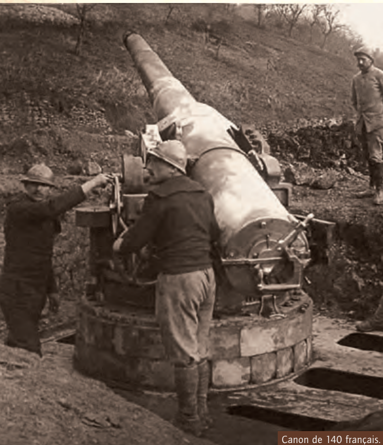
Canon de 140 français.