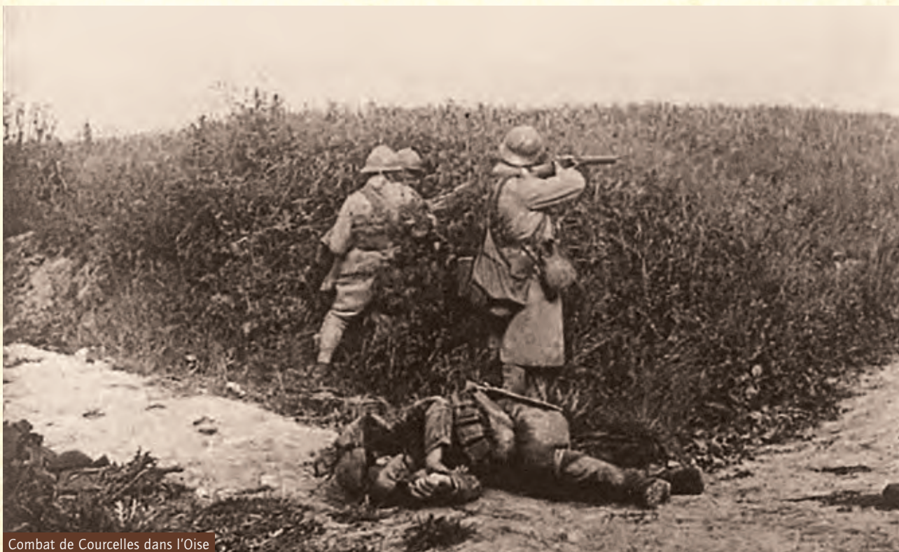
Combat de Courcelles dans l'Oise