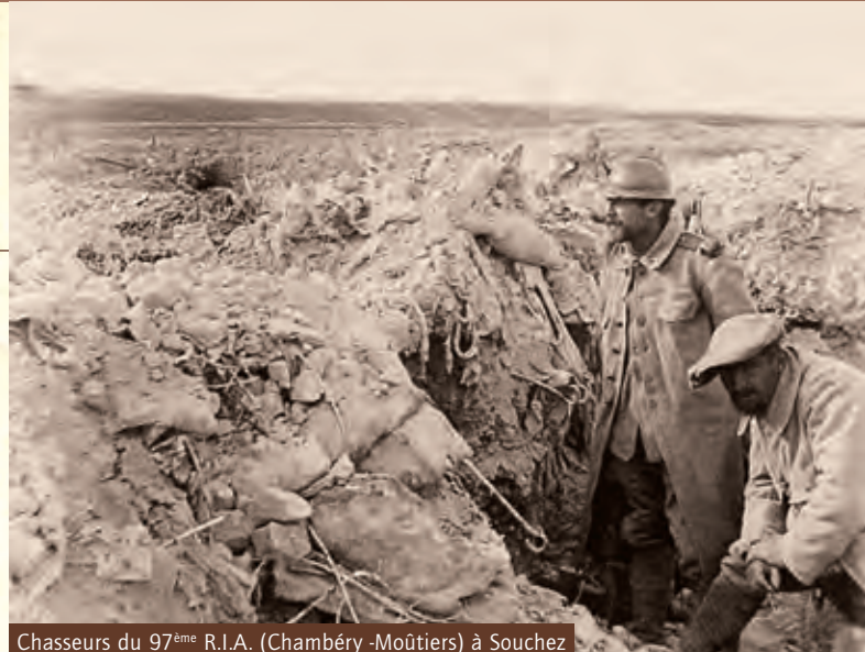
Chasseurs du 97 ème R.I.A. (Chambéry -Moûtiers) à Souchez