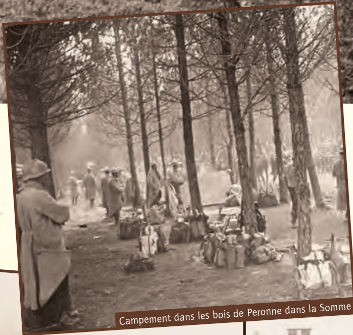
Campement dans les bois de Peronne dans la Somme