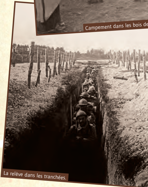
La relève dans les tranchées.