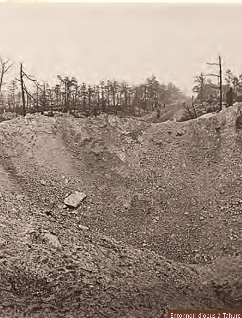
Entonnoir d'obus à Tahure