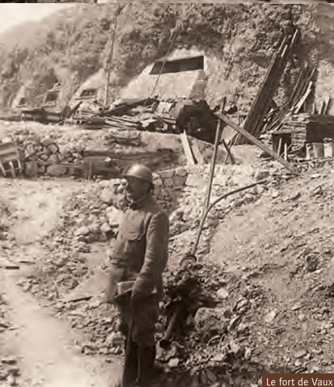
Le fort de Vaux