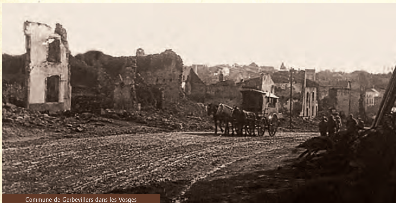
Commune de Gerbevillers dans les Vosges

Mais le 26 mai 1917, malgré ses problèmes de santé, il est classé bon pour le service et incorporé au 97 ème R.I. Il y sera agent de liaison. Il connaît les combats de l'Alsace secteur de l'Hartmannwillerkopft et du Collet du Linge, puis, en 1918, ceux de Champagne à Troyes et Reims pour finir dans les Flandres. Il est démobilisé le 9 août 1919. Il s'installe ensuite à Grenoble.