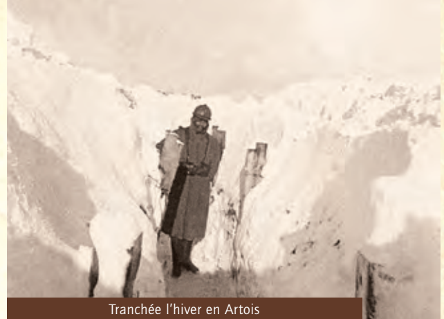
Tranchée l'hiver en Artois

Mobilisé et équipé en régiment de campagne, le 108 ème achève son organisation au camp de la Valbonne et le 16 octobre il s'embarque pour le camp de Châlons où il s'installe le 17 octobre au quartier national.