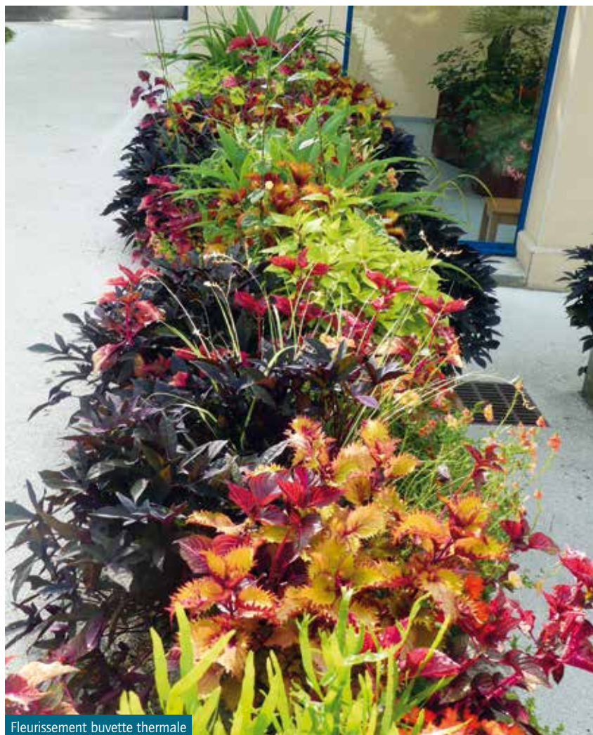
Fleurissement buvette thermale