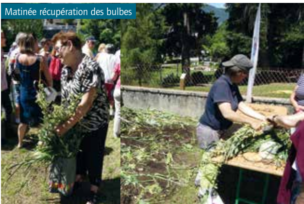
Matinée récupération des bulbes

Une matinée en mai pour permettre aux personnes de récupérer des bulbes du fleurissement printanier (en 2018 : 2 000 bulbes de tulipes, narcisses, fritillaires ont été distribués à plus de 150 personnes).