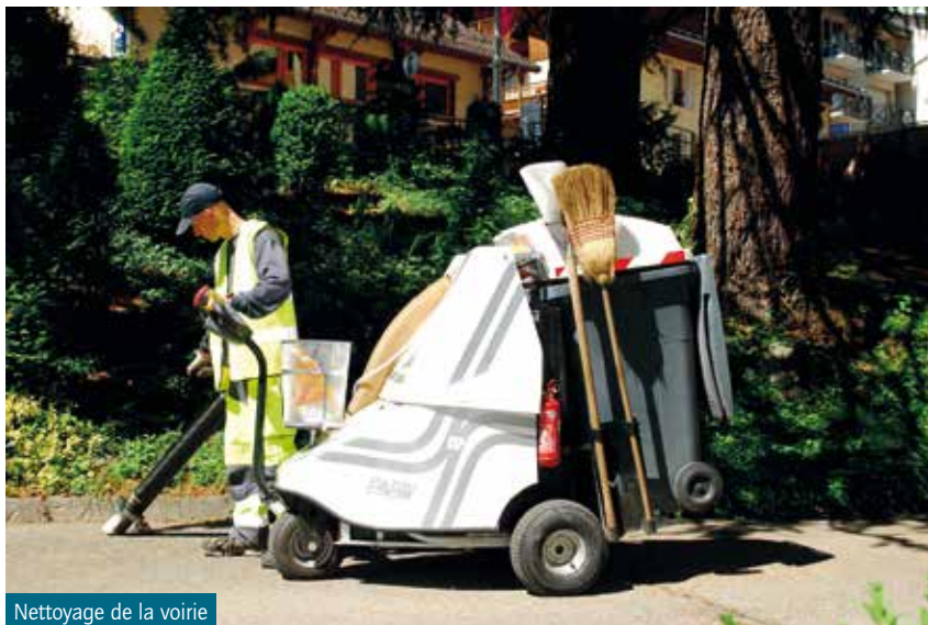
Nettoyage de la voirie