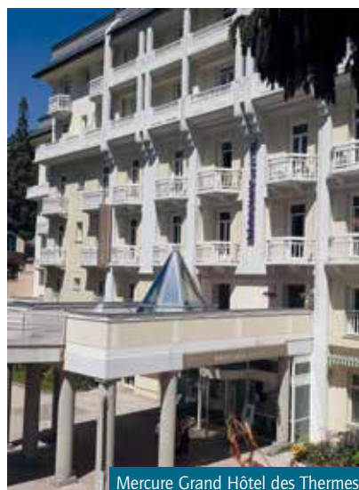
Mercure Grand Hôtel des Thermes