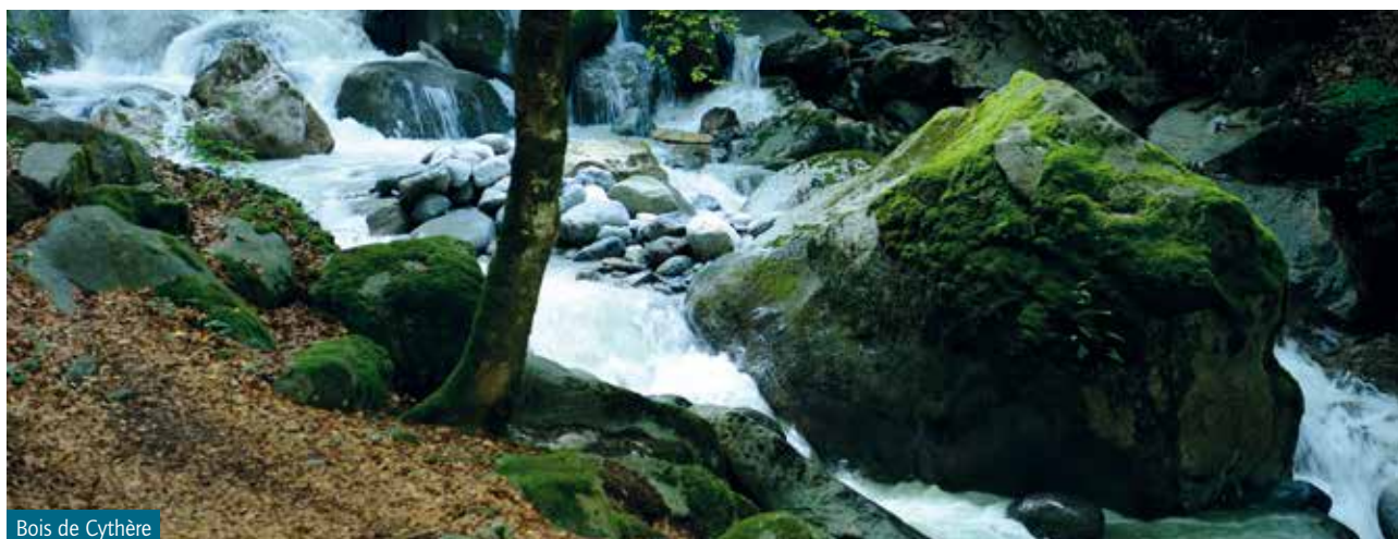
Bois de Cythère