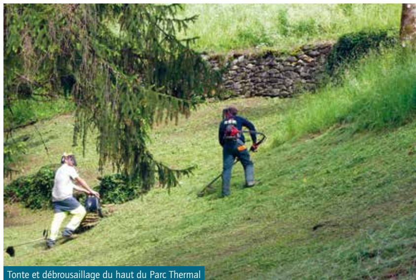
Tonte et débroussaillage du haut du Parc Thermal