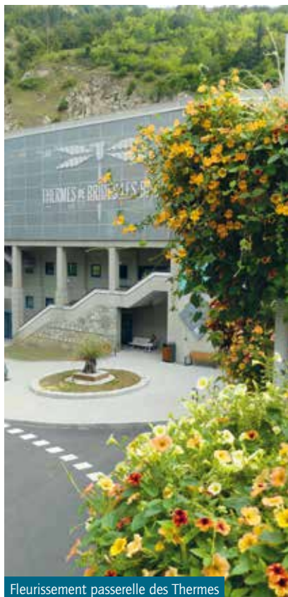
Fleurissement passerelle des Thermes

Pour cette année 2018, la commune a décidé d'éveiller les sens, avec la plantation d'essences originales. Dans un univers teinté de jaune et d'orange, une soixantaine de plantes flattent la vue, l'odorat ou bien encore le toucher. Un tableau floral dénommé "Sensations fortes".