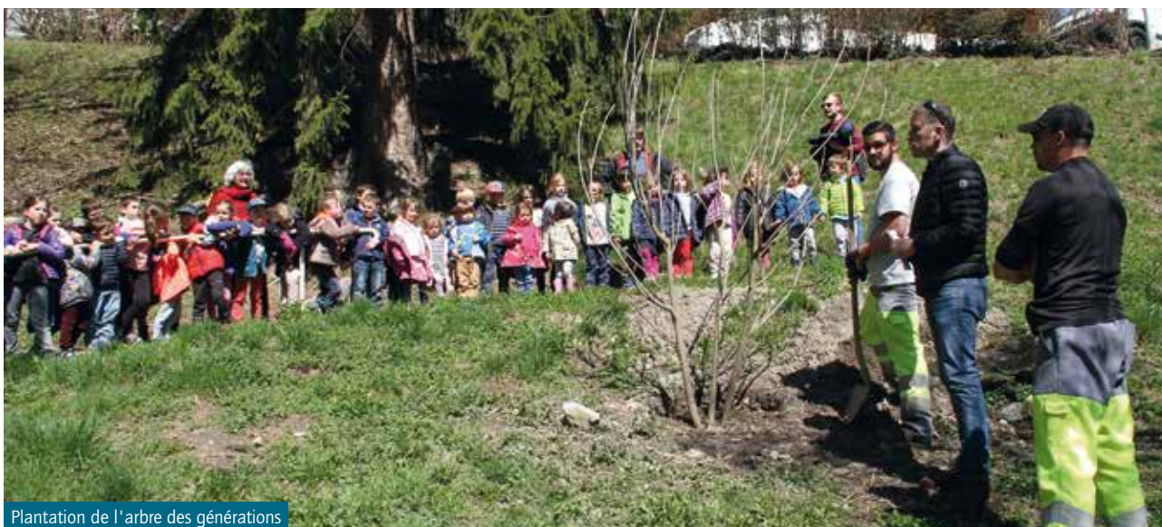
Plantation de l'arbre des générations

Les enfants de l'école participent également au festival organisé par l'Office de Tourisme "Equilibre et Gourmandise", au cours duquel ils sont sensibilisés à l'alimentation, à l'utilisation des produits locaux ou bien encore au tri.