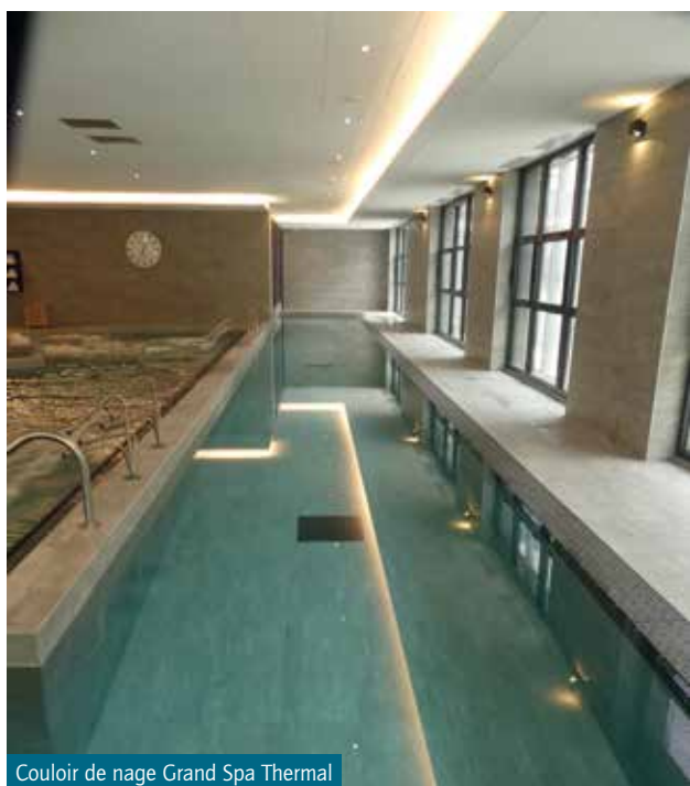
Couloir de nage Grand Spa Thermal

Brides-les-Bains est un village de 519 habitants permanents et environ 5 000 lits touristiques, pour une superficie de 263 hectares.