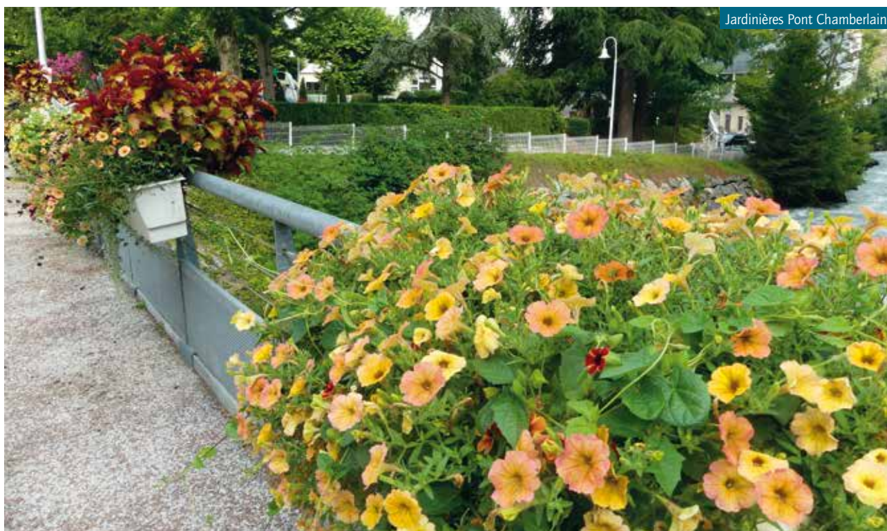
Jardinières Pont Chamberlain