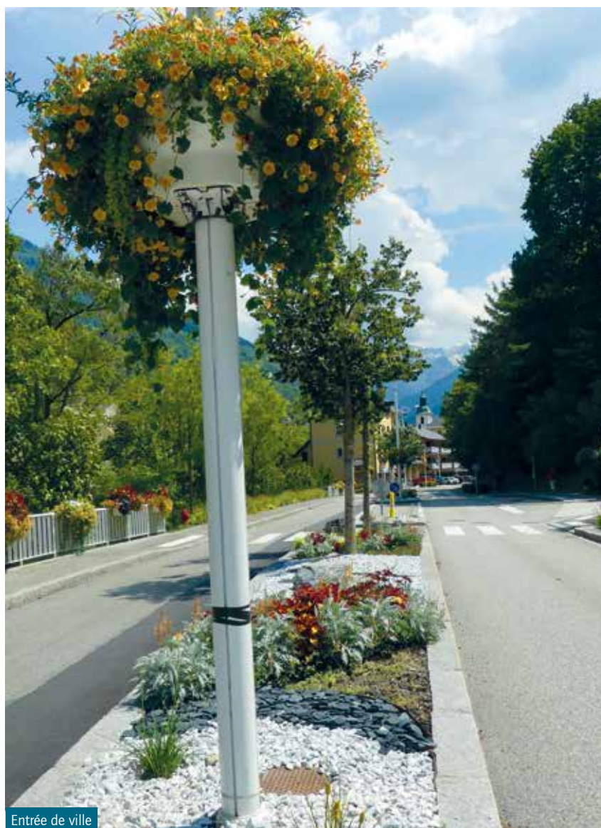
Entrée de ville