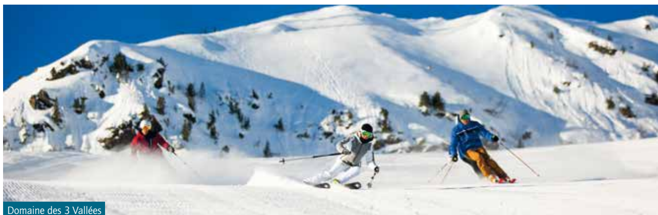
Domaine des 3 Vallées

Brides-les-Bains est aussi une station à part entière du domaine des 3 Vallées avec Courchevel, Méribel, Val Thorens, Les Ménuires, la Tania, Orelle et Saint-Martin-de-Belleville. Ce positionnement sur le tourisme hivernal est possible depuis les Jeux Olympiques d'Albertville en 1992 et la réalisation de la télécabine de l'Olympe qui relie le village à Méribel.