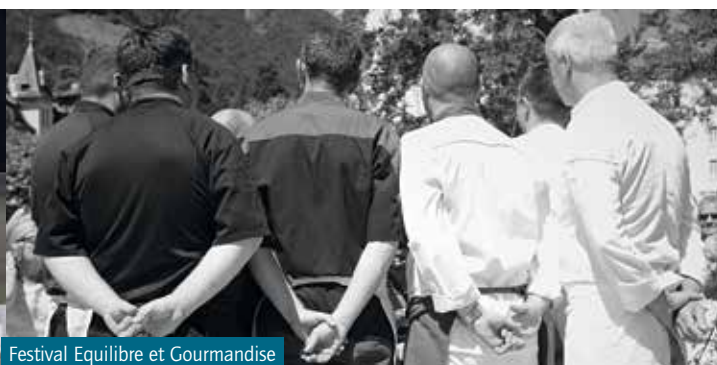
Festival Equilibre et Gourmandise