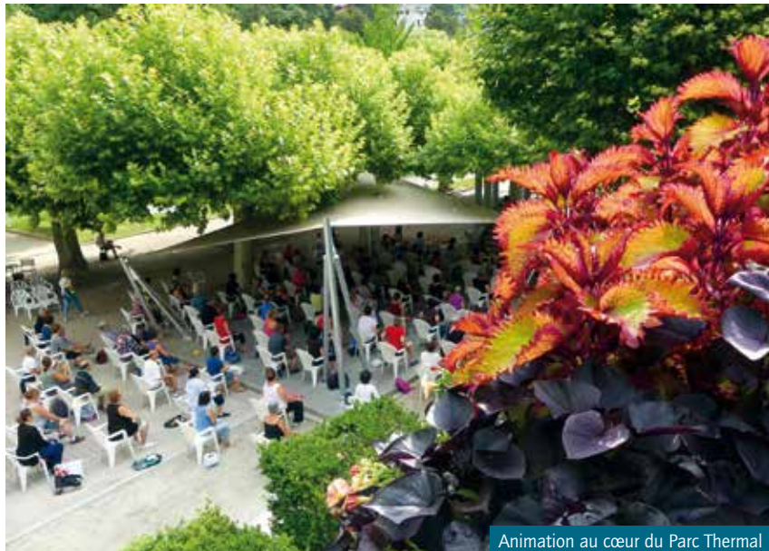
Animation au cœur du Parc Thermal

Le fleurissement est un vecteur esthétique et économique pour la commune avec une volonté de satisfaire ses hôtes mais également de faire venir.