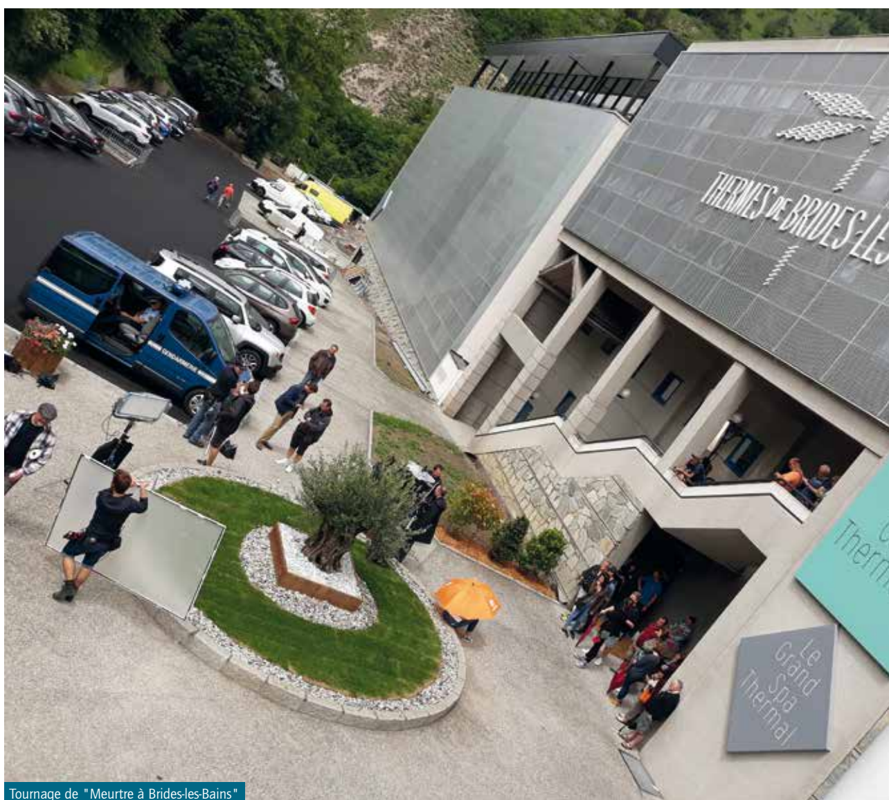
Tournage de "Meurtre à Brides-les-Bains"