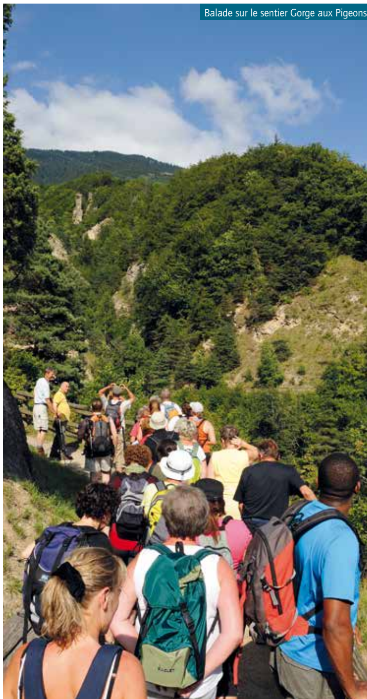
Balade sur le sentier Gorge aux Pigeons