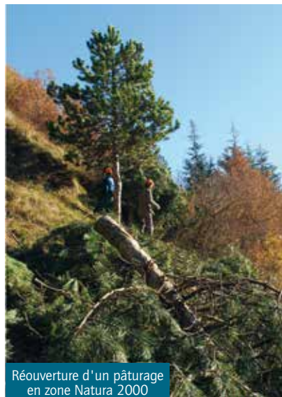
Réouverture d'un pâturage en zone Natura 2000